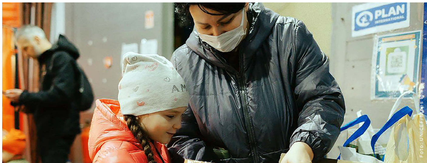
Mama in hči iz Černihiva v Ukrajini odpirata škatlo novih oblačil, ki so jih zagotovili UNICEF in partnerji v Moldaviji.

Ob svetovnem dnevu humanitarnosti se vsako leto poklonimo vsem humanitarnim delavcem in se spomnimo tistih, ki so pri opravljanju svojih dolžnosti izgubili življenje. Letošnja digitalna kampanja #NoMatterWhat oza-vešča in izvaja zagovorništvo za ljudi, ki so jih prizadele krize, kakršna je ta v Ukrajini, ter poudarja temeljna humanitarna načela humanosti, nepristranskosti, nevtralnosti in neodvisnosti. Kljub vse večjim izzivom smo v Združenih narodih neomajno zavezani zagotavljanju storitev za skupnosti, ki jim služimo - ne glede na to komu, kje in v kakšnih okoliščinah nudimo pomoč. #NoMatterWhat . ●